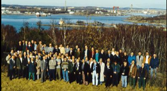
15-års Göteborg 1993